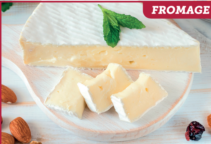
BRIE LE ROITELET Import 1795F LE KG