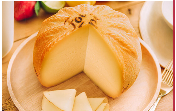
FOL EPI Import 3795F LE KG