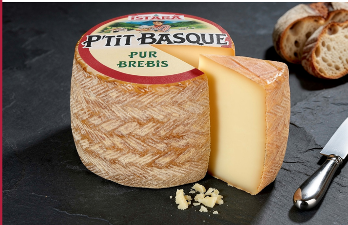
P'TIT BASQUE PUR BREBIS ISTARA Import 3095F LE KG