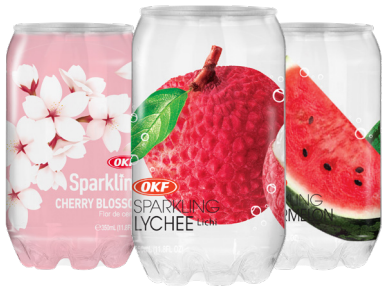
EAU PÉTILLANTE AROMATISÉE SPARKLING Différents parfums La canette de 350 ml Le L : 429 F 150 F LA CANETTE