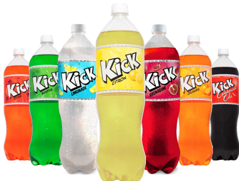
KICK Différents parfums La bouteille de 1,5 L Le L : 197 F 295 F LA BOUTEILLE