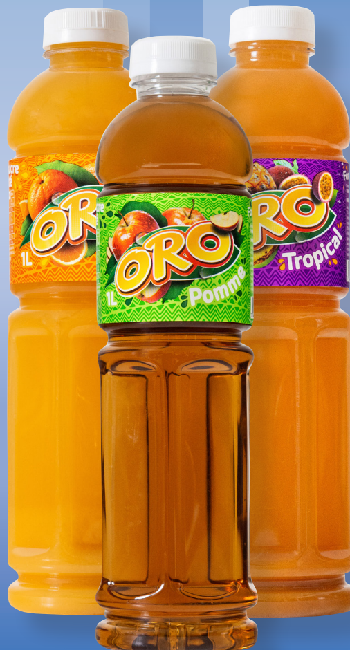
JUS ORO Au choix : pomme, orange ou tropical La bouteille de 1 L