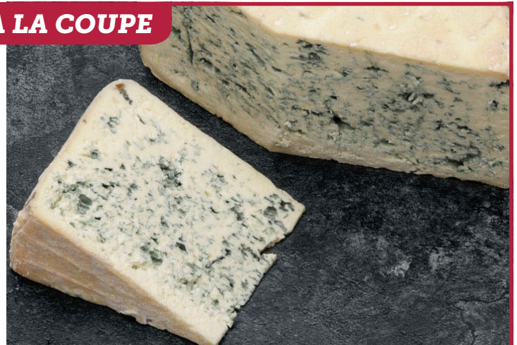
BLEU D'AUVERGNE Import 1995F LE KG