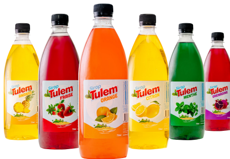
SIROP TULEM Au choix : orange, ananas, menthe, grenadine, citron ou fraise La bouteille de 75 cl Le L : 660 F 495 F LA BOUTEILLE