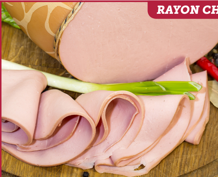
MORTADELLE DE POULET À L'AIL Import 895F LE KG