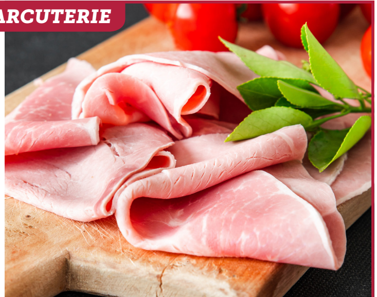
JAMBON BLANC SUPÉRIEUR Import 1395F LE KG