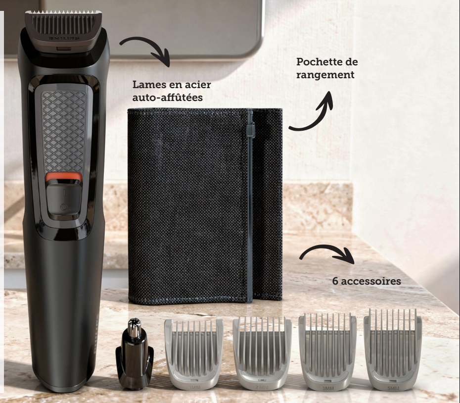
Lames en acier auto-affûtées