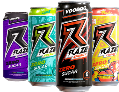
BOISSON ENERGISANTE ZÉRO SUCRE RAZE ENERGY Différents parfums La canette de 473 ml Le L : 811 F 385 F LA CANETTE